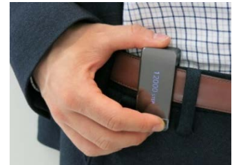
本プロジェクトに用いる IoT デバイス